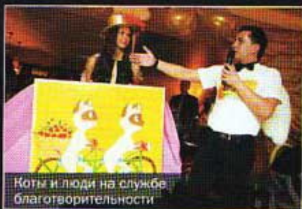
Коты и люди на службе благотворительности