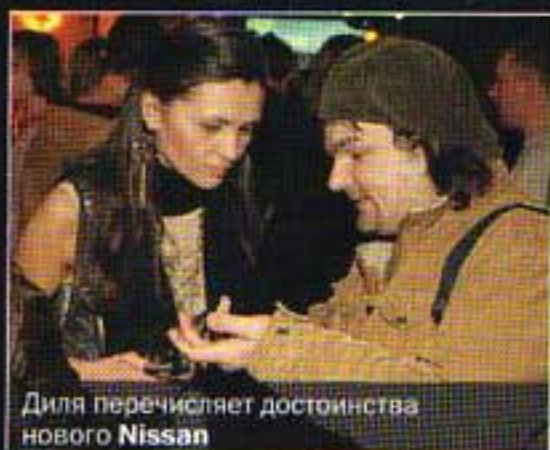
Дияля перечисляет достоинства нового Nissan

14 марта компания «Ниссан Мотор Украина» представила новый автомобиль Nissan Qashqai. Чтобы подчеркнуть функциональность и динамичный дизайн, организаторы провели презентацию в стиле уличной R'n'B культуры со всеми ее атрибутами: граффити на стенах, скейтерами и роллерами, «уличными бандами», соревнующимися в танце, игрой в streetball и, конечно, музыкой R'n'B.