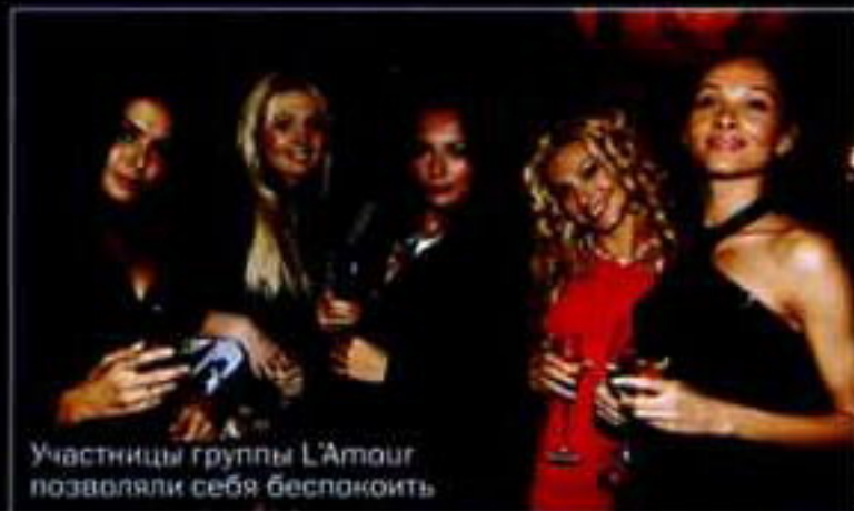
Участницы группы L'Amour позволяли себя беспозаботить