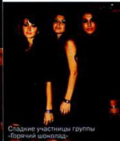
Сладкие участницы группы «Горячий шоколад»