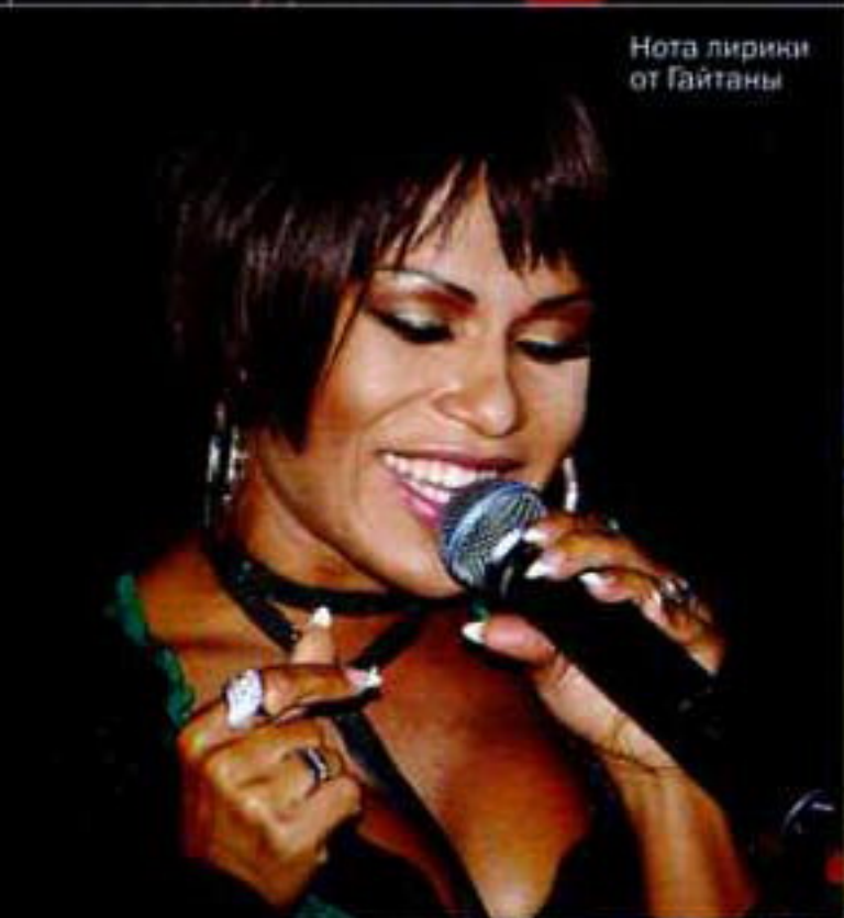
Нота лирики от Гайтаны