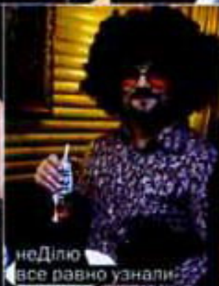
неДлю все равно узнали