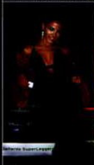
Аврора светит и в ночи