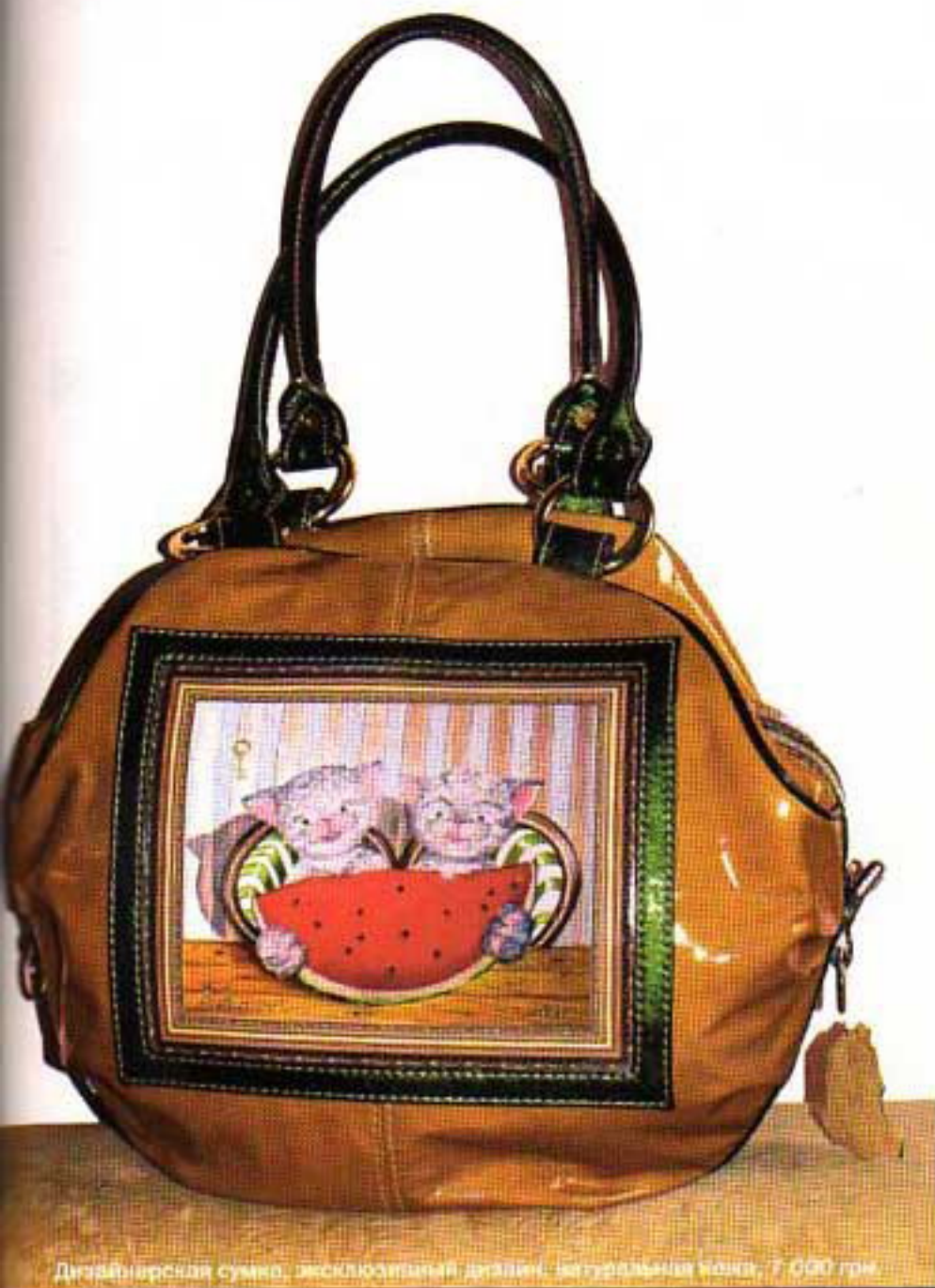
Дизайнерская сумка, эксклюзивный дизайн, натуральная кожа, 7 000 грн.

«Я рисую только котов, и уверена, что эта тема неисчерпаема. Что же касается эротики, то мне больше нравится, как эту тему раскрывают мужчины-художники»